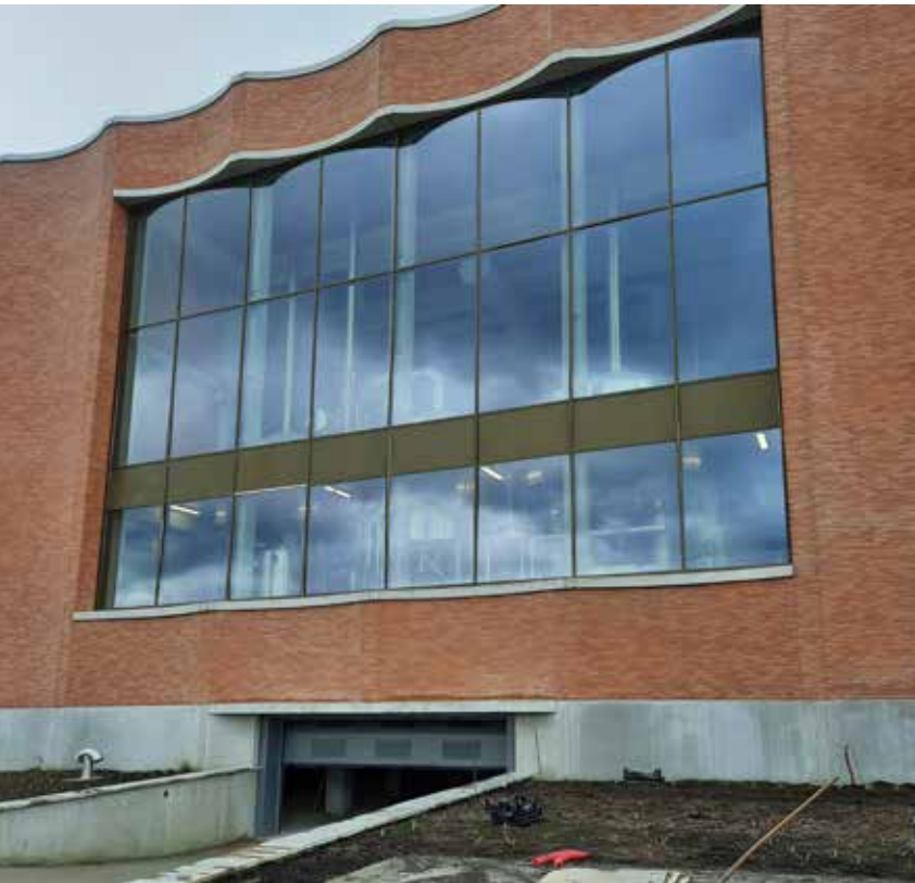
De grote raampartij aan de oostzijde weerspiegelt de dubbele functie van het nieuwe brouwerijgebouw.