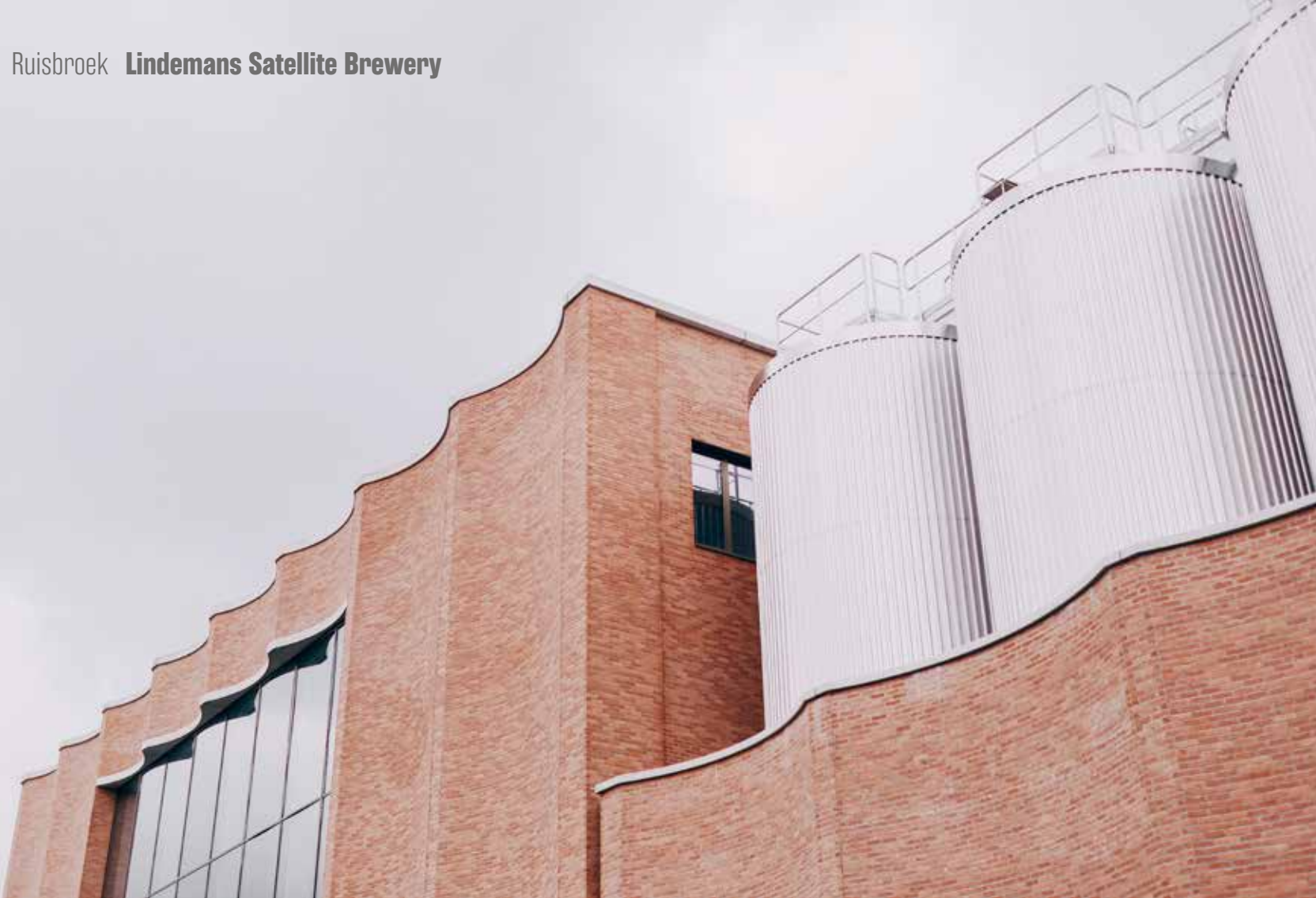
De concave baksteengevels, die zijn opgevat als een esthetische knipoog naar de karakteristieke cilindrische tanks in het gebouw, geven de Lindemans Satellite Brewery een authentieke toets.