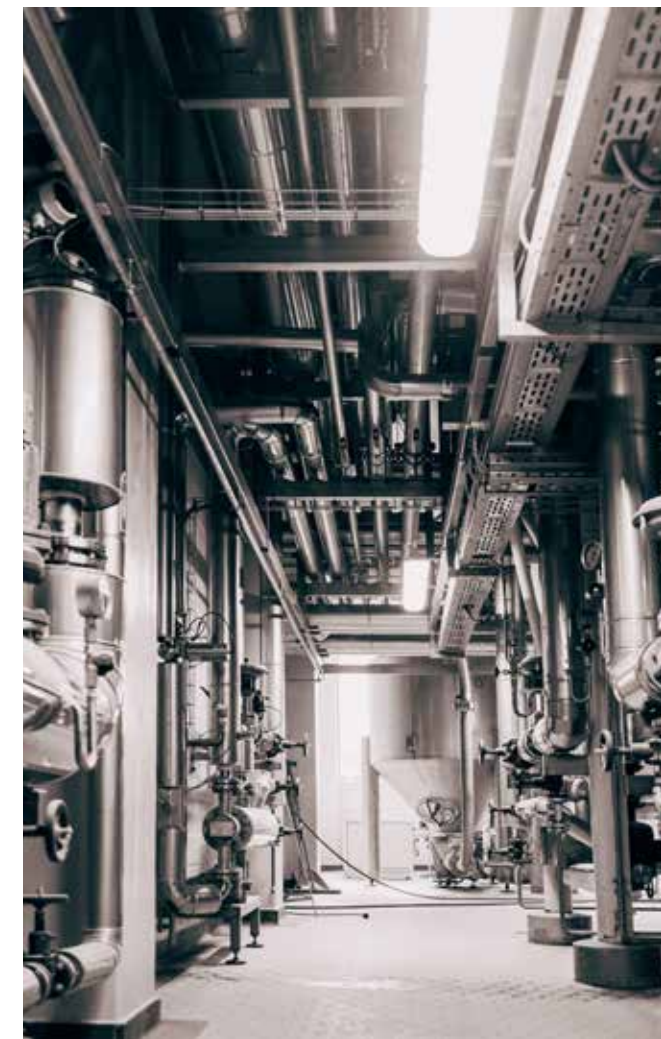
De geavanceerde brouwinstallatie is uitgerust met dryhopping-technologie en is bestemd voor de productie van hogegistingsbieren.