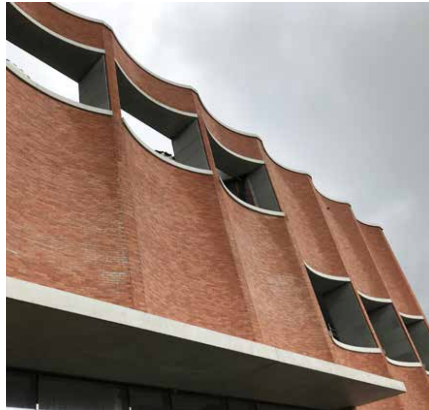
Er is van meet af aan veel aandacht besteed aan de opmerkelijke esthetiek.