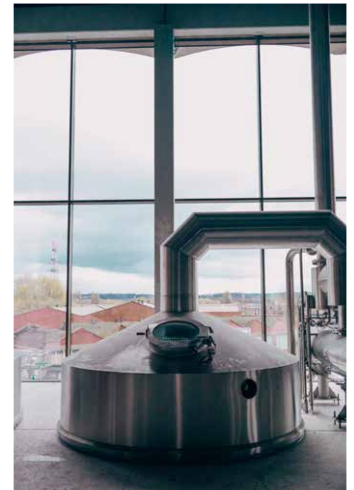
De kersverse brouwzaal kan tevens dienstdoen als ontvangst- en evenementenruimte.

"De Lindemans Satellite Brewery is geen gebouw waar er al tien van gezet zijn. Het was een uniek project"