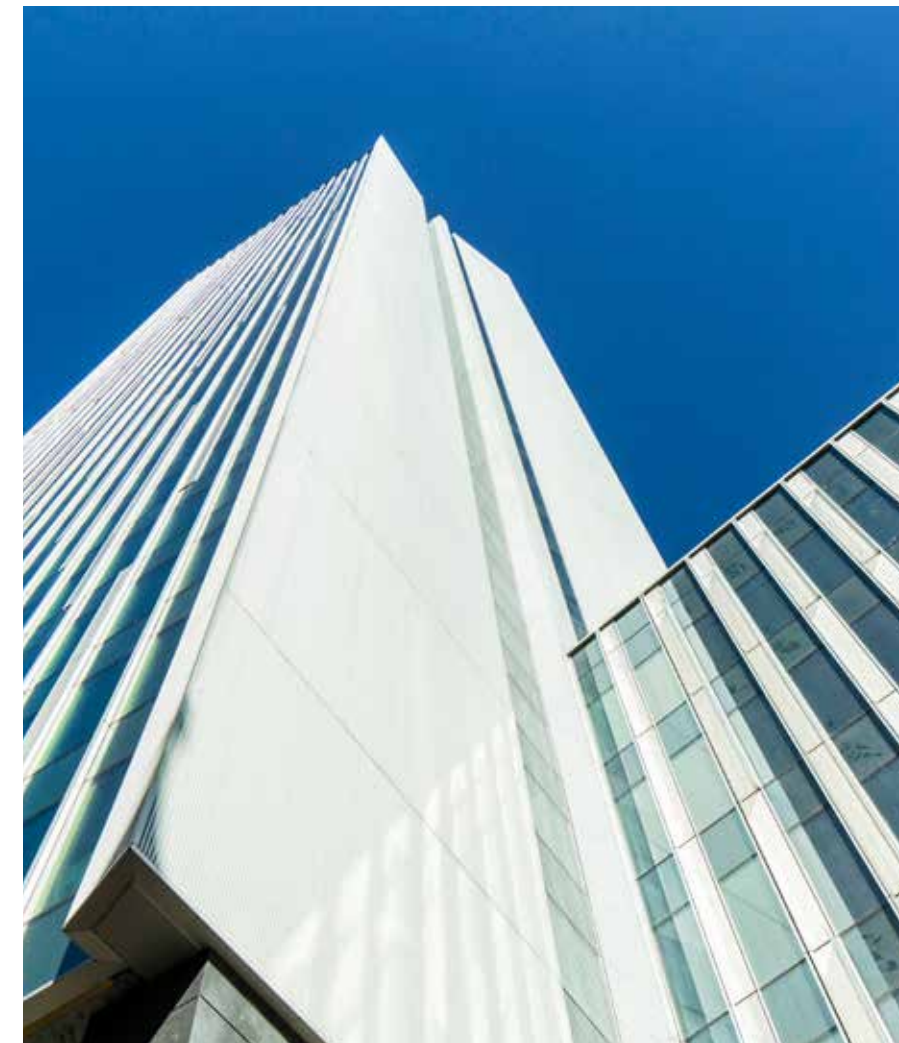
De Astro Tower, een nieuw icoon aan de Brusselse einder.

en Altiplan kozen voor een blauwe gevel met witte accenten. Ze verhoogden de dertig verdiepingen tellende gevel trouwens met drie 'verdiepingen', zodat de technische ruimtes vanop de straatkant niet meer zichtbaar zijn, maar zich achter de glazen gevel bevinden. Onder het gebouw bevinden zich ook vijf verdiepingen parkeeruimte.