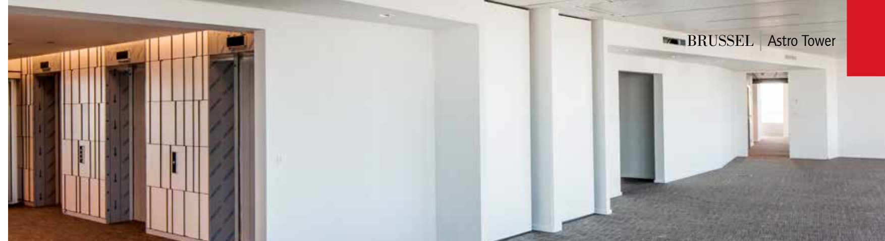
BRUSSEL | Astro Tower