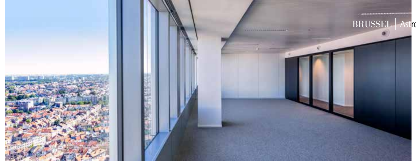
De Astro Toren kreeg een nieuwe façade, zodat daglicht het gebouw dieper kan binnendringen.

Met zijn speels blauw-wit patroon bepaalt de Astro Toren in Sint-Joost-ten-Node al enkele maanden de Brusselse skyline. De 107 meter hoge toren mag zich intussen ook het hoogste passiefgebouw in België noemen.