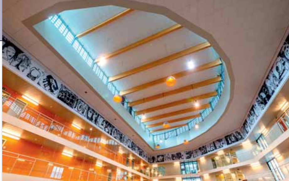
De oranje kleur, het hout tegen het plafond, de zachte maar indrukwekkende verlichting en het opvallende fresco in het hart van de commandopost maken de ruimte zo menselijk mogelijk.

Er is een patio en de kinderen die op bezoek komen, beschikken over een ingerichte tuin. Bovendien is de vloer van de bezoekerszaal verfraaid met tekeningen. In het hoofdgebouw is het panoptische centrum eveneens heel ruim en kleurrijk uitgebouwd. Hier maken de oranje kleur,