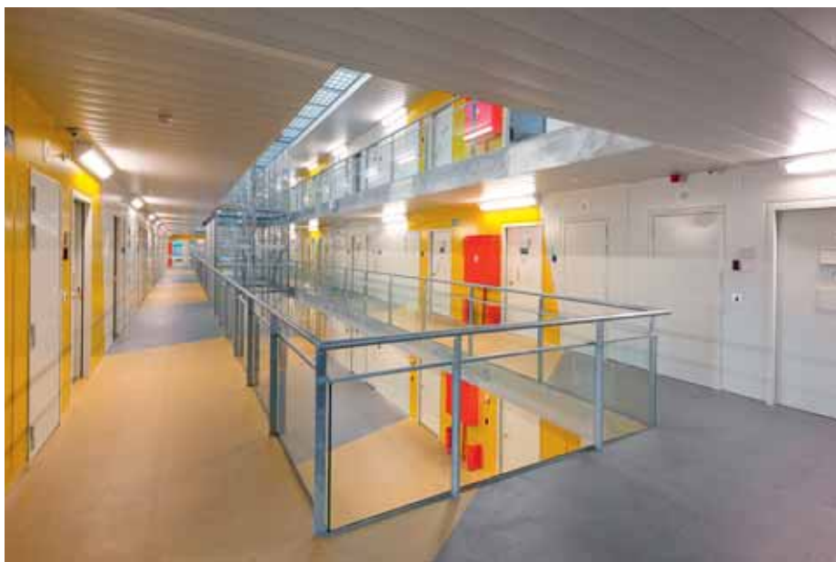
De ongeveer driehonderd mensen die hier dagelijks werken, komen terecht in een aangename werkomgeving.

Er is ook aan het personeel gedacht. De vlotte omgang en de communicatie tussen de verschillende diensten was een prioriteit om de interne uitwisseling te vereenvoudigen en een gebouw zoals dit meer ergonomisch te maken. Bovendien wilde men de ongeveer driehonderd personeelsleden een aangename werkomgeving bieden. - EC